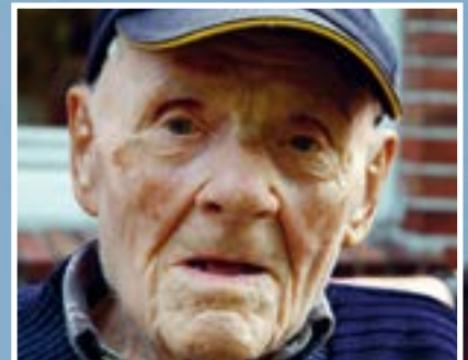
Glückwunsch: Jemgums ältester Einwohner ist 102 Jahre alt