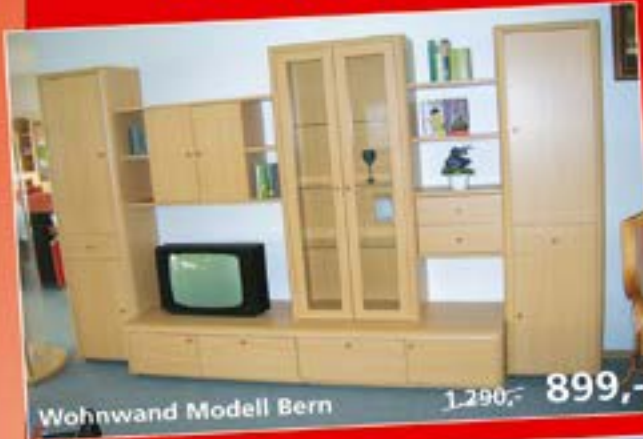
Wohnwand Modell Bern 1.290,- 899,-

Ziegeleistraße 2 · 26844 Jemgum Telefon 0 49 58 / 3 53