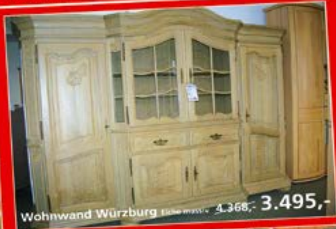
Wohnwand Würzburg Elke wvw - 4.368,- 3.495,-