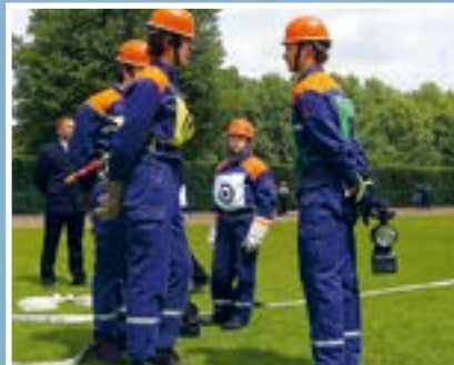
Wettbewerb: Feuerwehr und Jugendwehr beweisen wieder Schnelligkeit