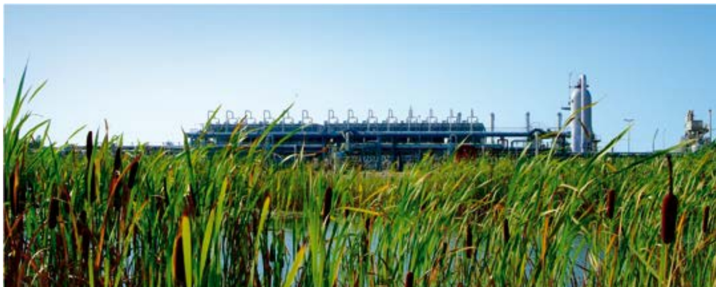
Zu sehen sind von einem Erdgasspeicher nur die oberirdigen Betriebsanlagen. Der Speicher liegt unter der Erde