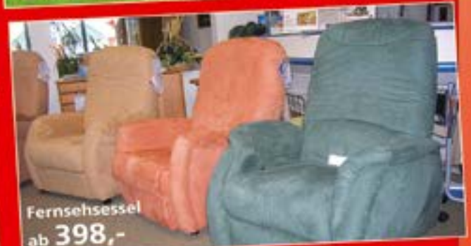
Fernsehessel ab 398,-

Weitere Angebote finden Sie in unserer Ausstellung!