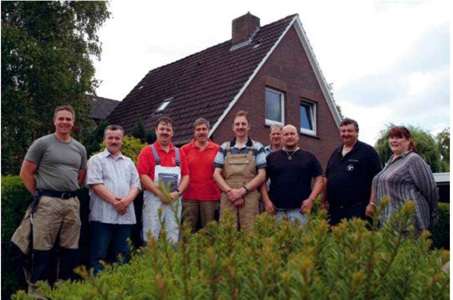
„De Handworkers“ - das sind insgesamt sieben kompetente Unternehmen, die sich zu einer starken Gemeinschaft zusammengetan haben. Das Bild entstand vor einem Objekt, das gemeinsam saniert wurde.