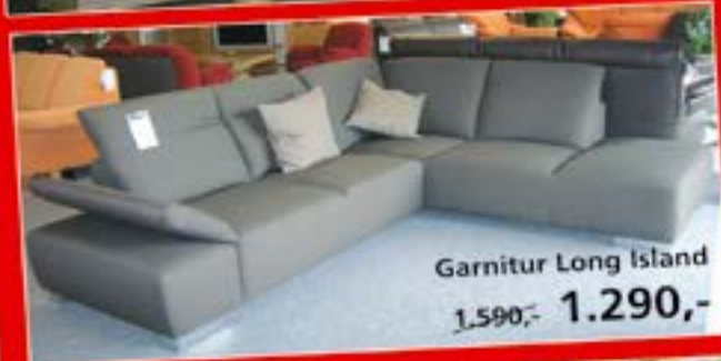
Garnitur Long Island 1.590,- 1.290,-