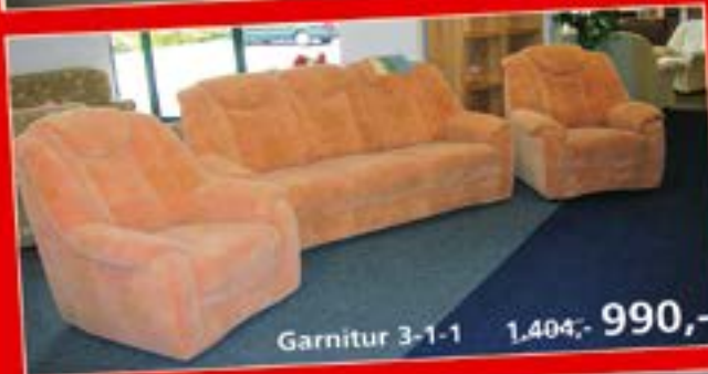
Garnitur 3-1-1 1.404,- 990,-