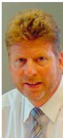
(Johann Tempel) Bürgermeister.

Liebe Besucherinnen und Besucher des Müggenmarktes, ganz herzlich dürfen wir Sie auch im Namen des Rates und der Verwaltung der Gemeinde Jemgum zum 59. Müggenmarkt begrüßen.