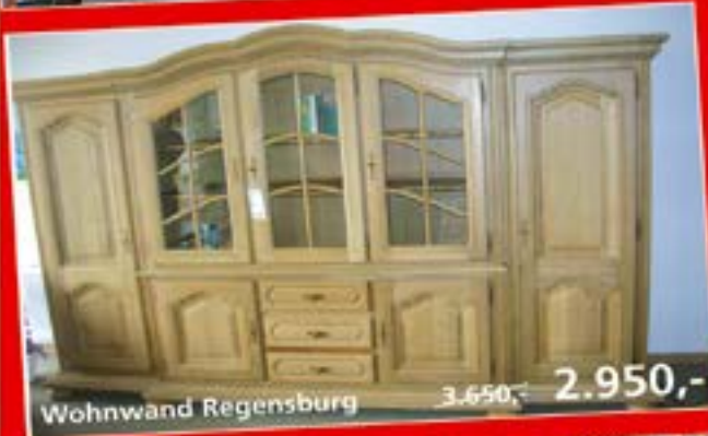
Wohnwand Regensburg 3.650,- 2.950,-