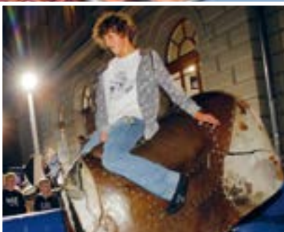
Aufsitzen und durchhalten - solange es geht. Neu ist das Rodeoreiten