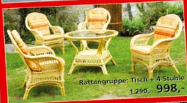
Rattangruppe: Tisch + 4 Stühle 1.290,- 998,-