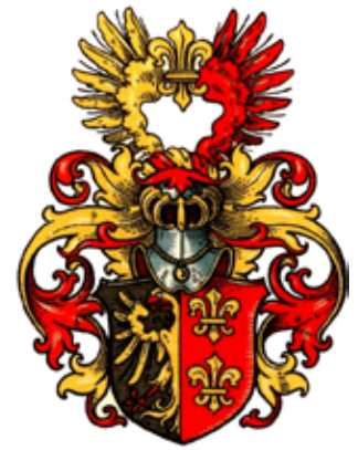
Wappen des Heimat- und Kulturvereins. Häuptling Ewo van Jemgum 1587, auch in der Ludgeri-Kirche in Norden